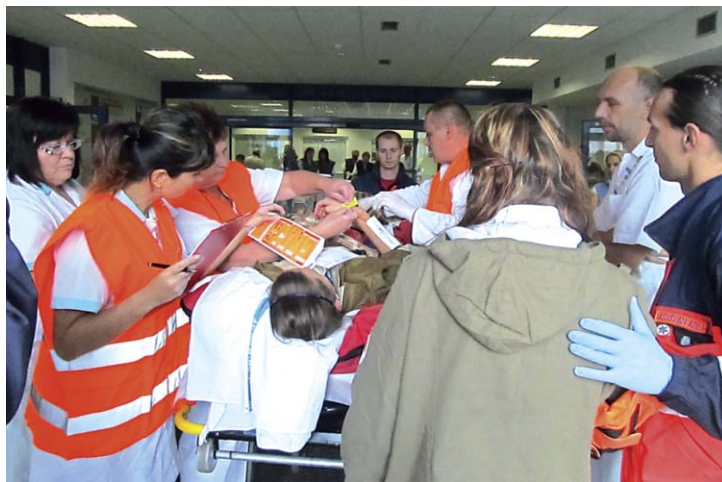
Lékaři Klatovské nemocnice přebírají od záchranářů zraněné po nehodě autobusu. Hromadný příjem je přímo ve vestibulu nemocnice.

mocnice přivezeno a předává informace dál. Do vestibulu nemocnice, který se mění na hlavní příjem, je povolán zdravotnický personál, který zajišťuje převzetí a odvoz pojezdovými lůžky